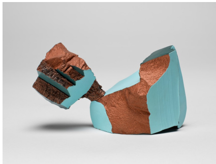
Ken Price (1935-2012), a commencé a travaillé dans les années 1960