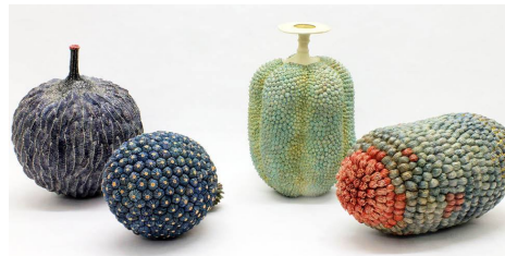
Kaori Kurihara, depuis environ 2012