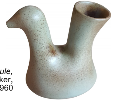
Vase poule, Joséphine Baker, 1960