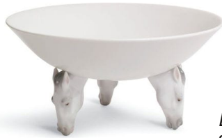
Equus pedestal, société Lladró, 2008

> Qui représente un animal, en forme d'animal