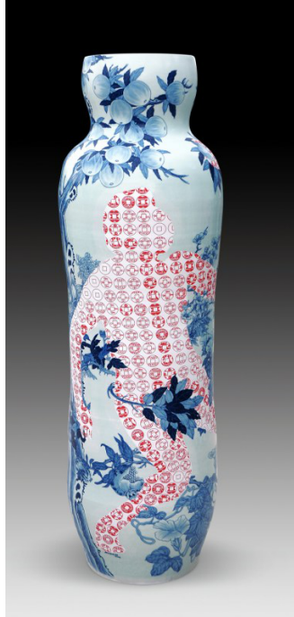
peinture sous couverte technique de peinture sur porcelaine particulière dans laquelle la couleur appliquée sur la porcelaine non émaillée avant la deuxième cuisson avec un pinceau ou un pistolet à peinture Temptation—Life of Goods No. 2, Sin-ying Ho, 2010