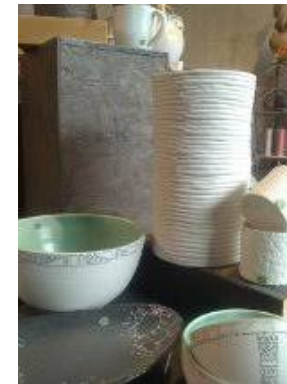
Charlotte Vouilloz, artisane d'art

A partir de colombins (=petits boudins de terre enroulés sur eux-mêmes) Il s'agit de la technique la plus ancienne . Permet la réalisation de vases ou autres pièces avec une grande liberté de forme et de dimension.