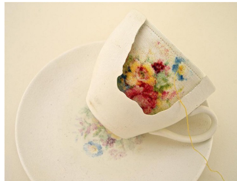
Bouquet , Michelle Taylor, 2013 céramique et broderie