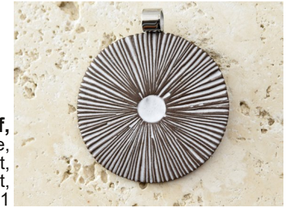
bijou, pendentif, Les Bijoux de LiliBulle, Cécile Barraut Crozet, artisane d'art, depuis 2011