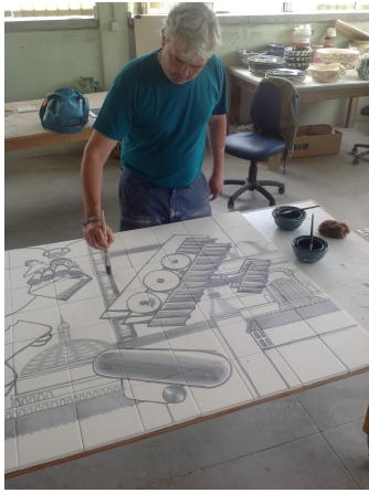
Hervé Di Rosa, un artiste contemporain travaille avec une fabrique d'azulejos (au Portugal et en Espagne; carreau ou ensemble de carreaux de faïence décorés, tradition ancienne datant du 18e siècle)