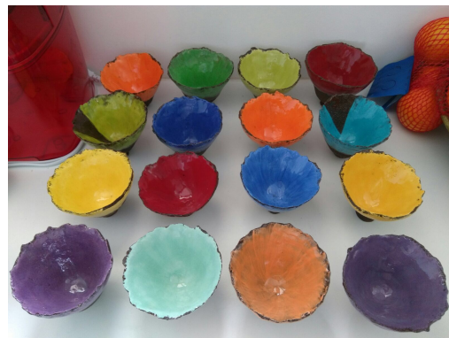
Pascale Elgozi, contemporain