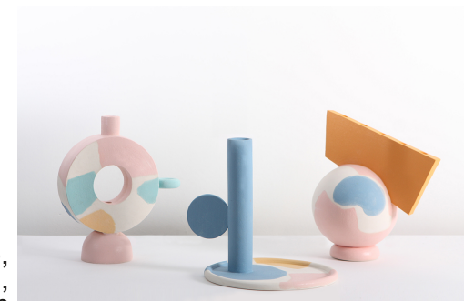
collection Meme, Katia Tolstykh, contemporain