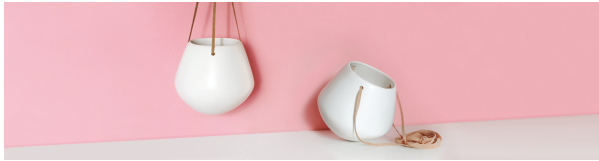
faïence slider suspension, studio tandem

Céramiques à pâte poreuse qu'il est nécessaire d'imperméabiliser à l'aide d'une glaçure ou émail .