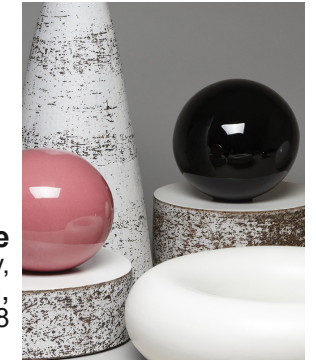
porcelaine Kristin Mckirdy, galerie Jousse entreprise, 2018

>Mises au point au cours du XIXème siècle , les céramiques techniques sont des "terres" purifiées cuites à très haute température, conçues pour des applications industrielles particulièrement exigeantes.