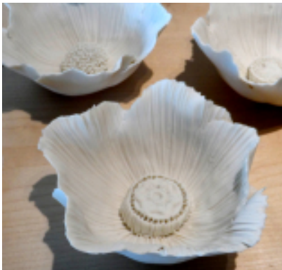
Florence Trucho, depuis 2005