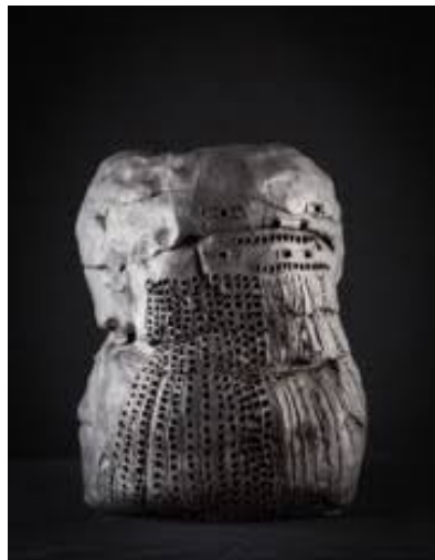
Oeil Oeil Nez Bouche , Hideaki Yoshikawa, 2005