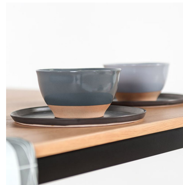
peinture à la main House Doctor