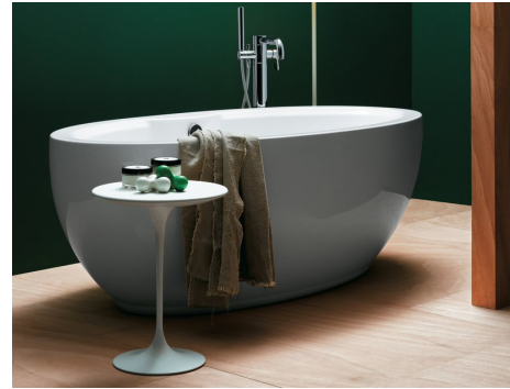
baignoire société AZZURRA, Claudio Papa, commence à travailler vers 1990