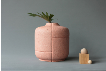
Curl Up+ , Rita Koralevics, contemporain

On sculpte d'abord un moule en céramique, puis on y coule une barbotine (=terre liquéfiée) Permet la répétition des formes à l'identique.