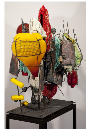
R&D IV RE-15-1a Raymon Elozua, 2014, ceramique, verre