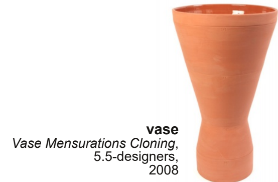
vase Vase Mensurations Cloning, 5.5-designers, 2008