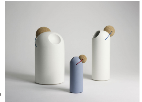
Tomas Kral, travaille depuis 2009, céramique et liège