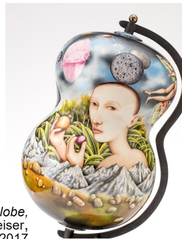
Random house globe, Kurt Weiser, 2017