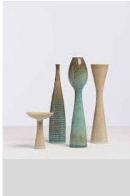
Stig Lindberg, un suédois, de la fin des années 30 aux années 70, défini comme l'âge d'or du design scandinave

Permet de concevoir des formes circulaires très différentes.