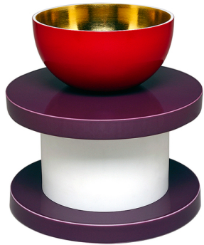
Coupe Diane , Ettore Sottsass, 1994 porcelaine et or 24 carats