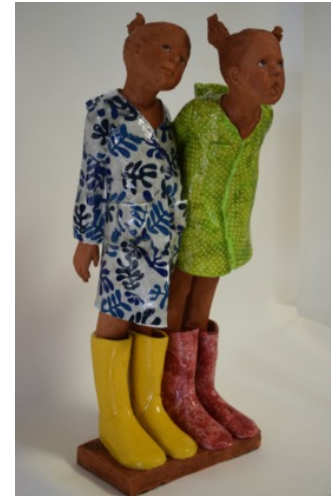
Les Insolentes, Swanne, commence en 2006