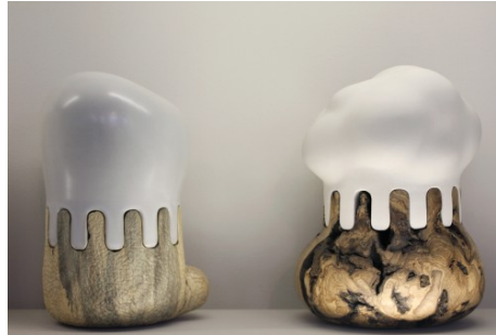
Projet Hasard , Roxane Andrès, 2013 céramique et bois