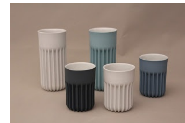
Celine Cavallin, depuis 2012, modèle en impression 3D pour coulage de porcelaine