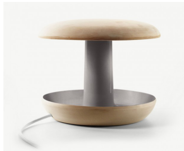
poterie lampe onddo, studio de design industriel Iratzoki Lizaso, vers 2016