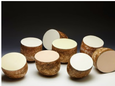
Terracota, Kristinn Mckirkdy, intérieur lisse, moderne/ extérieur rustique