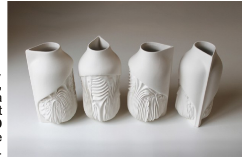
Chroma vases, Isaie Bloch, hybridation dans la technique; le projet mélange l'impression 3D à la technique traditionnelle de coulage de céramique.