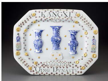
Mara Superior, kangxi period, qing dynasty, collection 2018, porcelaine et oxydes

>Mises au point au cours du XIXème siècle , les céramiques techniques sont des "terres" purifiées cuites à très haute température, conçues pour des applications industrielles particulièrement exigeantes.