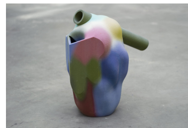
Jug, Laureline Galliot, 2012, prototype en impression 3D avec de la poudre, mais prototype non étanche donc réalisé ensuite en céramique