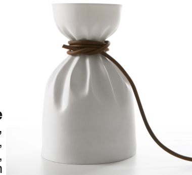
luminaire Applique Crease, Simon Naouri, Triode design, design contemporain