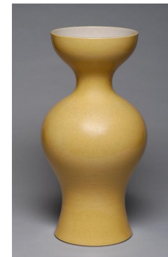
gré Objet casanier, Jean Arp (1886-1966), Cité de la ceramique à Sèvres

Céramiques dont la pâte est vitrifiée dans la masse et donc imperméable .