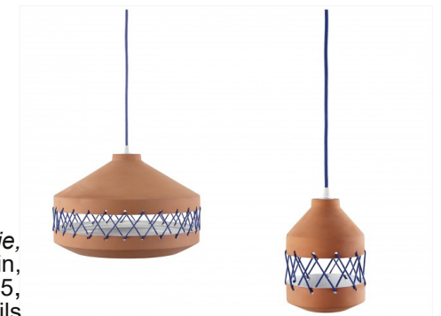
Suspensions Tie , Laura Marin, 2015, terre cuite et fils