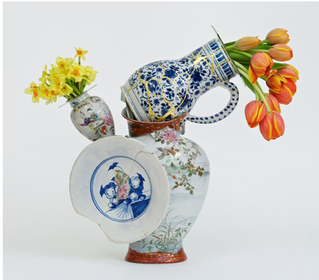
Fragented vase 3, Boukes De Vries, 2015, porcelaine de chine et verre