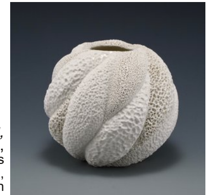
Vase cailey corail collage round, Judi Tavill, inspiration des côtes lors de ses explorations, contemporain