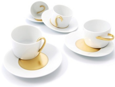
art de la table Tasse Ouvriers, 5.5 designers, 2005