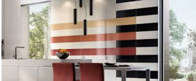
carrelage Collection Creative System 4.0, groupe Villeroy et Boch, depuis 1748