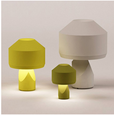
Dot, famille de lampes, trois tailles et différentes couleurs, Samuel Accoceberry